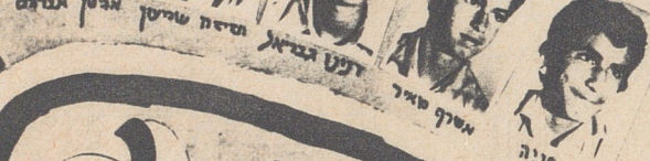
אהרון מאיר חגי חנה אדרי מאיר יואל יצחק