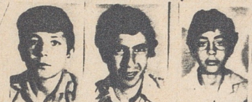
דן כלפה יואל יואל יצחק דניאל יואל