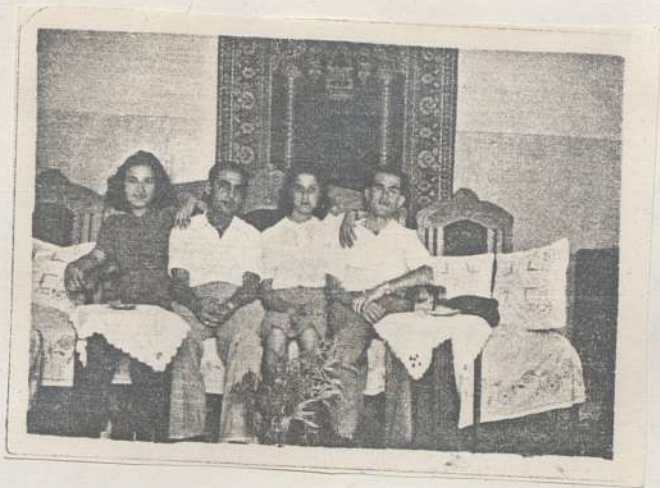
הבית החדש עם אלוהי שמיים ורחמים