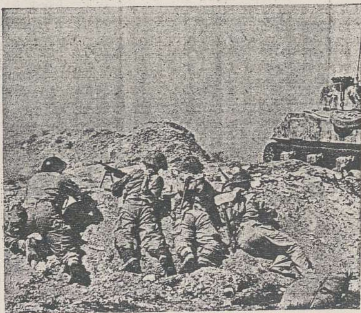
בקרב על עזה מילא הצגים תפקיד מרכזי — ותפקיד החי"ר הצטמצם לנטיעה אחריו וטיהור העורף.

גם כאן ההתקדמות בלילה, לאורך עשרות קילומטרים ולמרות התנגדות האויב, אפשרה קודם-כל הודות לאומץ לבם של האנשים, ובעיקר מפקדי כוח-החוד. לדוגמא: ערב כיבוש האנ-יוניס אירע המקרה הבא: מפקד כוח-החוד, אשר פקד בעצמו על הטנק הקידמי ביותר, עלה במוצב (סוף בעמ' 14)