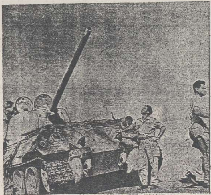
ס"ה 34, דקות מספר לאחר נפילתו בידי כוחותינו במבצע סיני.

על הכוח הראשון הוטלה משימה כבר סמוך להתחלת מבצע קדש. משנתברר כי מיתחם אום-כתף חוסם את הכביש הראשי ניצנה-אבו-עגילה, תוכננה פעולה לכבושו, והכוח נדרש כתגבורת לכוחות הפורצים. הירידה נעשתה בחפזון רב, ומאחר שנתברר כי עוד באותו לילה יש לתקוף, נכנסו לפעולה פלוגות החר"מש בלבד, מאחר שה-טנקים לא הספיקו להגיע. ההתקפה בוצעה עם שחר והחר"מש, שנתקל בהתנגדות חזקה ביותר, כגון ביצורים, מיקוש, תותחי נ"ט, נאלץ לסגת תוך אבידות כבדות. מתחם אום-כתף נעזב לאחר מכן ע"י המצרים.